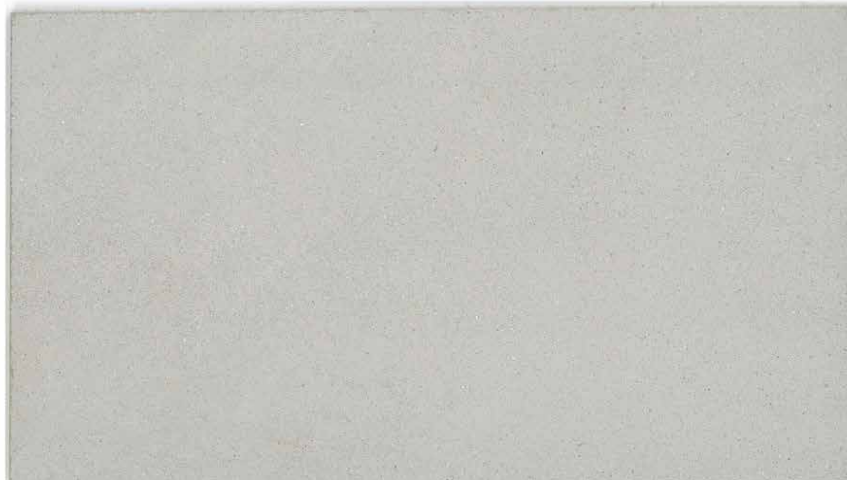
M. HYDRO MAR01