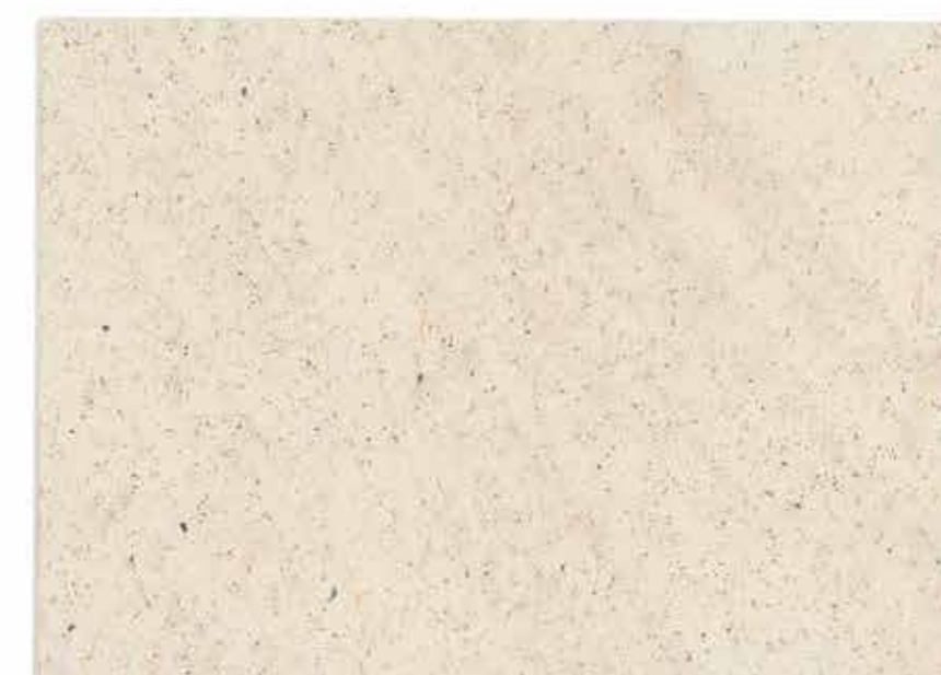
M. SAND NEUTRAL BASE