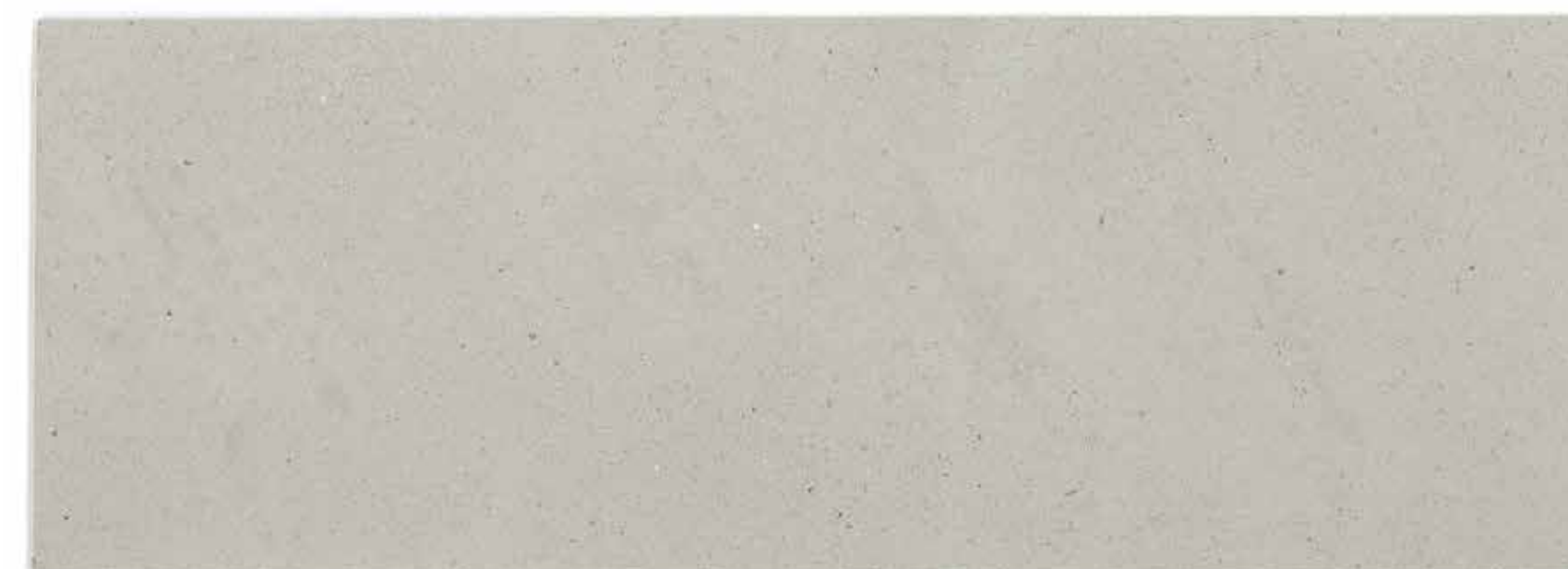
M. EXTRA MAR01

COLORS WITH * ARE NOT AVAILABLE FOR M. HYDRO