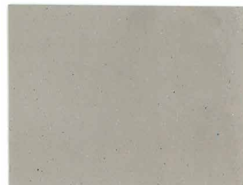
M. SAND MAR01