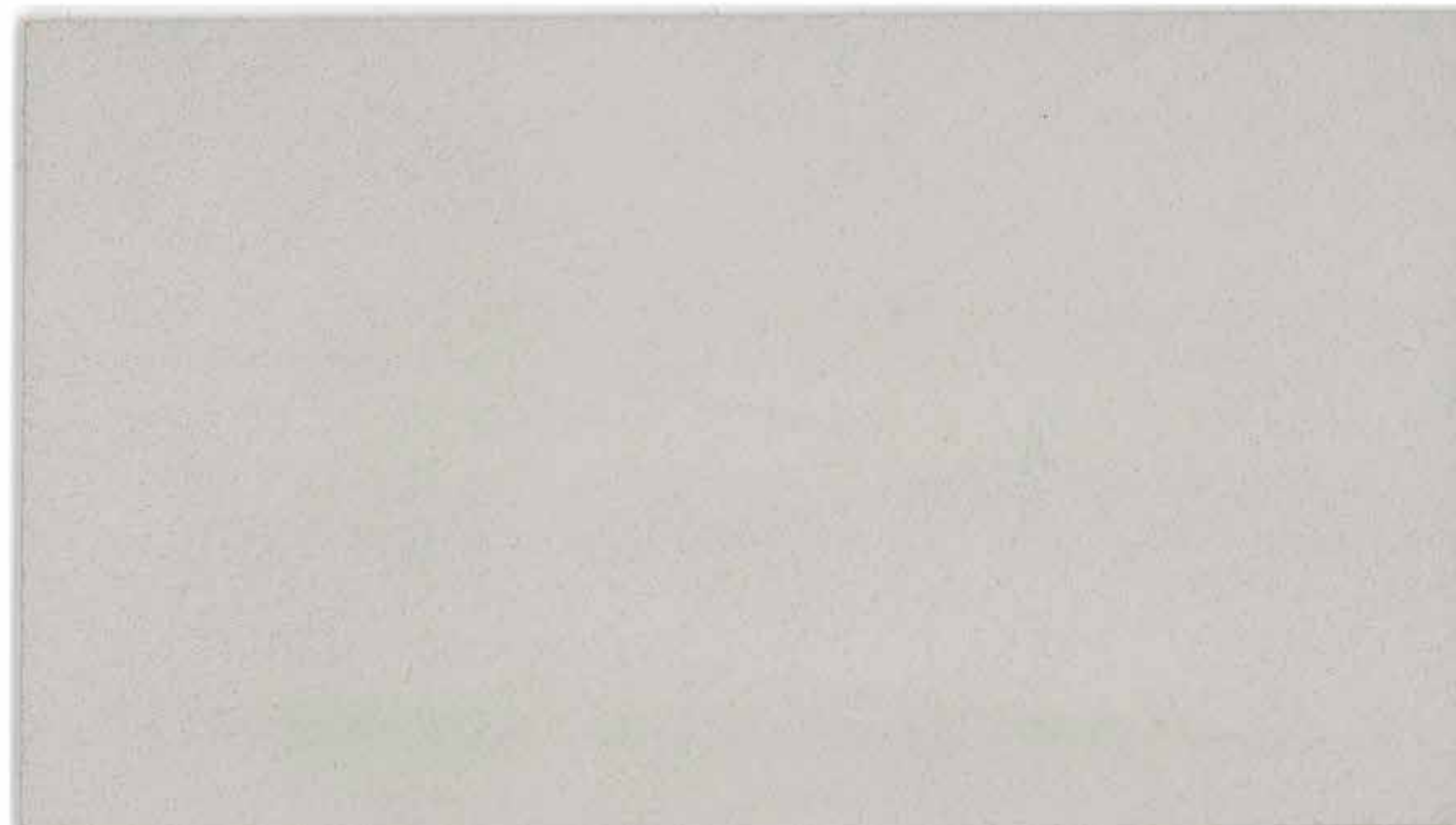
M. SATIN MAR01

Little color samples are made with Marmorin.